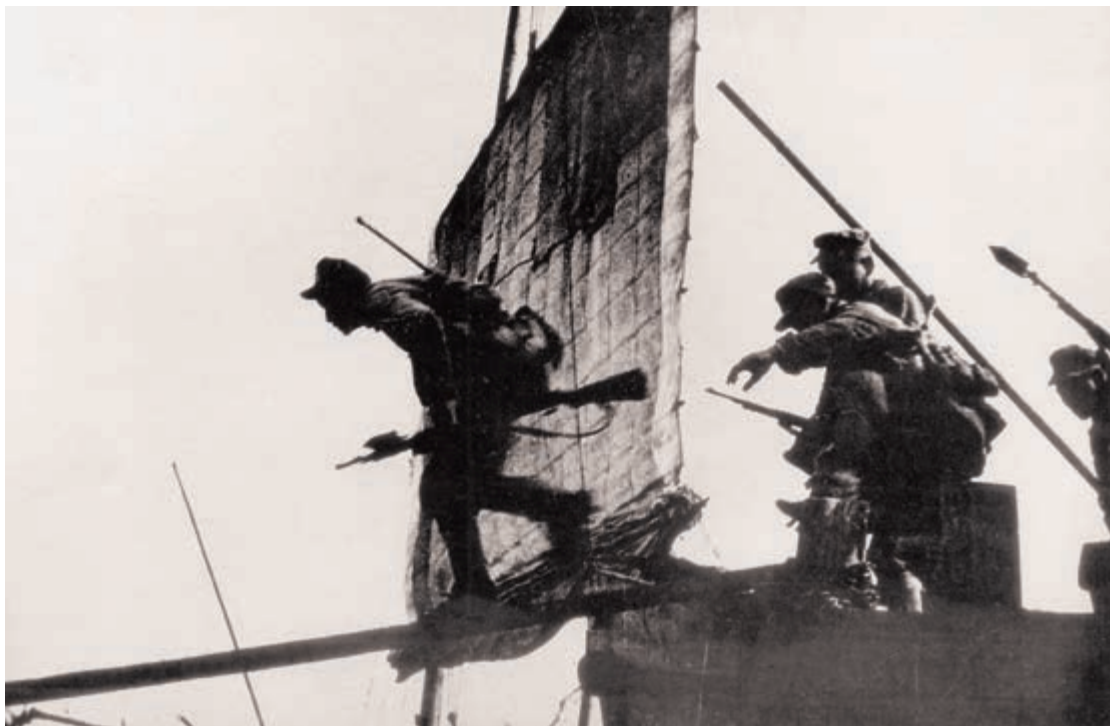
人民解放军胜利登上长江南岸