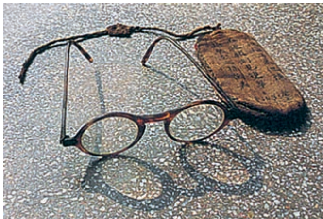
朱德买给母亲的眼镜

勤劳的家庭是有规律有组织的。我的祖父是一个中国标本式的农民，到八九十岁还非耕田不可，不耕田就会害病，直到临死前不久还在地里劳动。祖母是家庭的组织者，一切生产事务由她管理分派，每年除夕就分派好一年的工作。每天天还没亮，母亲就第一个起身，接着听见祖父起来的声音，接着大家都离开床铺，喂猪的喂猪，砍柴的砍柴，挑水的挑水。母亲在家庭里极能任劳任怨。她性格和蔼，没有打骂过我们，也没有同任何人吵过架。因此，虽然在这样的大