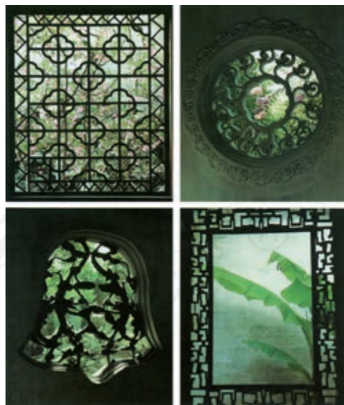
拙政园秋色