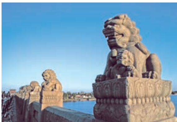
卢沟桥上的石狮子