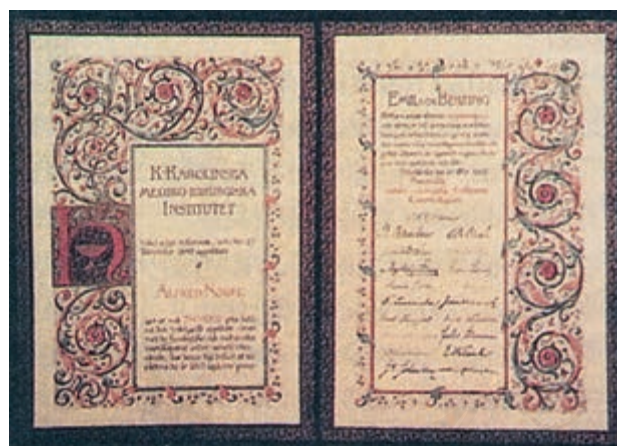
贝林的诺贝尔奖证书